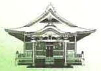
諏訪大社上社前宮 氏