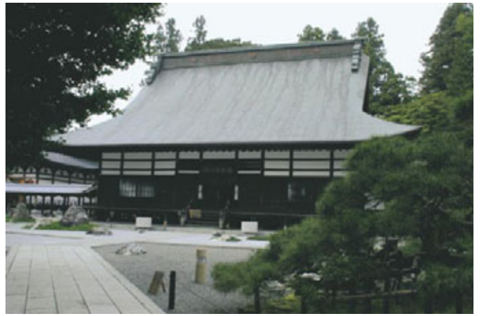
慈雲寺・本堂の大棟には武田菱の紋。ここにある「信玄の矢除石」は矢除けの力を持ち、信玄がその念力を宿す矢除札を持って合戦へ赴いたと伝わる。

慈雲寺を出て、下諏訪の町並みを見下ろしながら坂道をゆっくり下ると、御影石の大鳥居が見えてくる。春宮である。建物の配置は秋宮と同じだが、また違った趣がある。建物に施された数々の彫刻たち。秋宮も見事であるが、春宮の彫刻も勝るとも劣らない素晴らしさである。幣拝殿正面、うねるような流線を描く、腰羽目の波。虹梁の上、今にも咲きほころびそうな牡丹。動き出しそうな唐獅子、勇ましい飛竜。時を忘れ、その躍動感に魅入っていた。