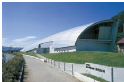
【下諏訪町立諏訪湖博物館・赤彦記念館】

武田家が諏訪明神より授かり、代々家宝とした諏訪法性兜。原作では勘助は勝頼がこの兜をかぶり、家督を継ぐその日を夢見た。