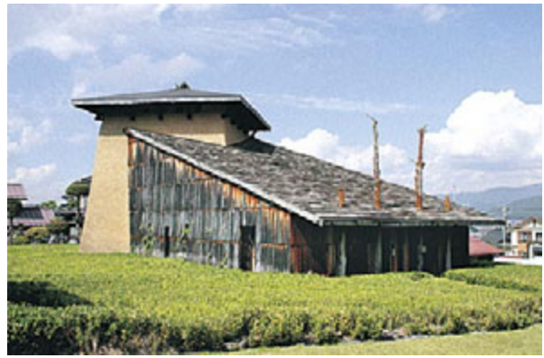
大きく傾斜した屋根が特徴的な茅野市神長官守矢史料館。御柱のイメージか、入口の庇を貫く四本の木。外壁はサワラ手割板に覆われ、内壁は特別調合の壁土。この史料館の魅力は建物にもある。

そこからのんびり徒歩10分。鳥居を抜け、石段を上がり、さらに坂道を数百メートル行くと、諏訪大社・上社前宮に到着。建御名方神が最初に居住し、諏訪信仰発祥の地とも伝わる。静かな境内、すぐ脇を流れる小川のせせらぎ。どこからか、鳥の歌声が響いていた。