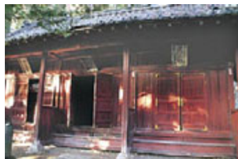
頼岳寺の境内奥に建つ諏訪氏頼岳寺御廟所。三室に分かれ、左から頼水、父頼忠、母理昌院の霊が眠る。参道には樹齢約三百年の杉並木。