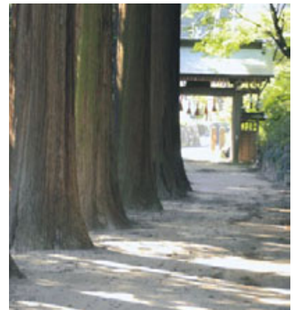
樹齢七百年以上を数えるサワラの大木が連なる参道は厳かな雰囲気漂う。遠く高島城に相対するかのような正門から境内へ。