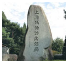
諏訪惣領家の屋敷跡。信玄に滅ぼされた後、武田の重臣・板垣信方が諏訪郡代として置かれたため、通称板垣平と呼ばれる。武田氏の諏訪統治の拠点。