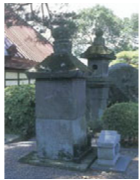
頼重院には頼重の首が祀られているといわれ(写真右)、胴体は山梨県の東光寺にある頼重の墓に祀られているという。首を祀る際、彼の怨念により七つに割れたという巨石は、苔むし、粉々に砕け何とも荒々しい。何かしら底冷えのする思いである(写真左)。