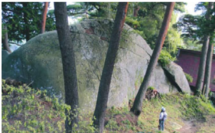
上原城跡二の郭に残る物見岩は間近に立つとその大きさに圧倒される。代々諏訪惣領家の居城であり、頼重もここを本拠としていた。

細くうねる坂道を進み山へと登っていく。上原城諏訪氏館跡の石碑を過ぎ、やがて標高978mの上原城跡に到着。静かな山道を行くと、まもなく金比羅神社がある三の郭に到着。この上が、物見岩という巨岩がある二の郭であり、その数メートル上が主郭である。眼下に広がる諏訪盆地。在りし日の頼重は、この風景を眺めながら何を思ったのだろうか。彼方の山裾には、諏訪家が大祝を務め、信玄にも篤く信仰されたという、諏訪大社が見えていた。